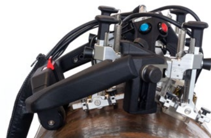
Сканер AxSEAM с 4 преобразователями на кольцевом сварном шве трубы с НД 324 мм