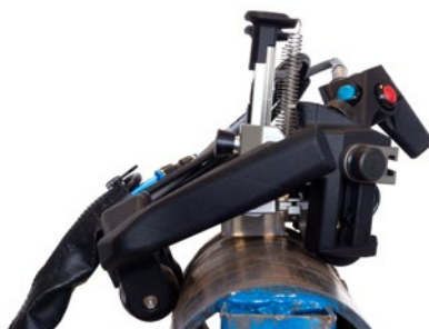
Сканер AxSEAM с 2 преобразователями на кольцевом сварном шве трубы с НД 114 мм

Сканер AxSEAM используется для контроля продольных или кольцевых сварных швов, и требует минимальных настроек. Он представляет собой комплексную эффективную систему сканирования и обеспечивает быстрый возврат инвестиций (ROI).